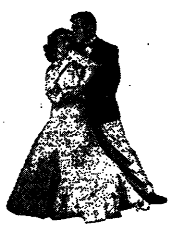
Clark Gable et Joan Crawford.

concours stupides, une simple lettre suffit pour se le procurer. Le reste du temps est consacré au rock avec un goût soigné de l'enchaînement et de la progression. En fait, une telle émission est de nouveau possible aujourd'hui parce que le rock, grâce à la nouvelle vague, est redevenu une musique de radio.